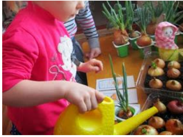
Ухаживаем и поливаем лук.